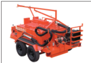
دستگاه KERA 145 HD مجهز به دو درب جهت اضافه نمودن مواد به منظور انجام پروژه‌های بزرگ با حجم بالا می‌باشد.