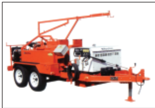
دستگاه KERA 145 HD به همراه کمپرسور به ظرفیت ۸۰ cfm که جز موارد اختیاری خریدار می‌باشد.