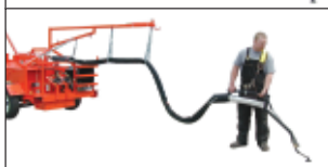
بوم نگهدارنده شیلنگ مواد ضمن نگهداشتن شیلنگ در طول و زوایای مختلف از برخورد آن به زمین و همچنین خشکی اپراتور جلوگیری می‌نماید.

ترموستات دیک در محل نانو کنترل اصلی به صورت خودکار دقیقاً دمای دلخواه را تثبیت می‌نماید.